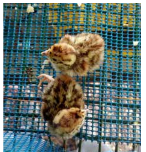
გარემოს დაცვისა და სოფლის მეურნეობის სამინისტროს ყოველთვიური გამოცემა